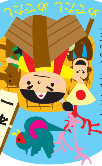
「桃の籠を持って歩きます」