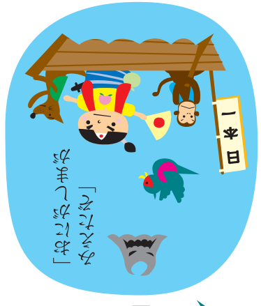
「桃の籠を持って歩きます」