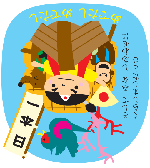
「桃の籠を持って歩きます」