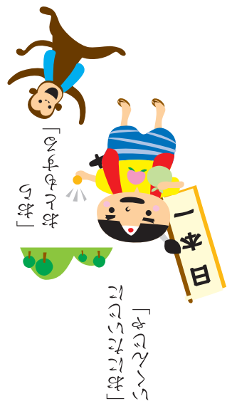
「桃の籠を持って歩きます」